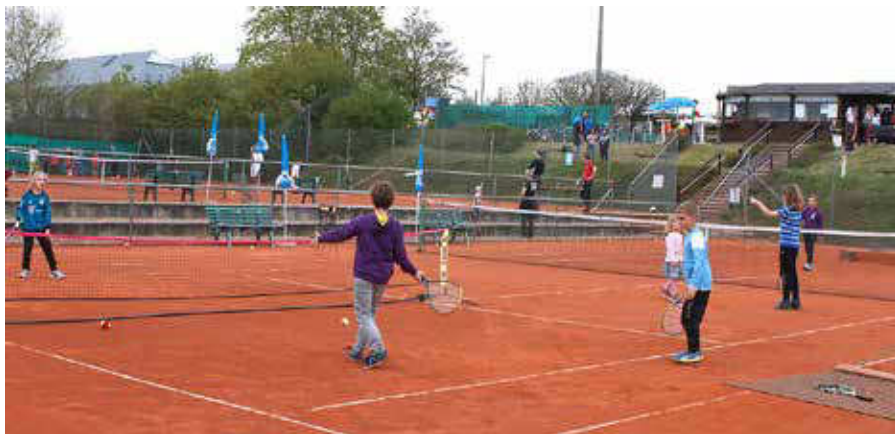
Aktionstag „Deutschland spielt Tennis“