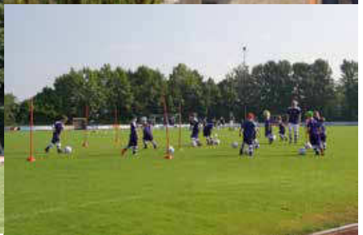
Impressionen aus der Fußballschule 2015